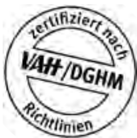
VAH-Prüfsiegel zu Desinfektionsmitteln

Zur Händedesinfektion sollen nur Produkte verwendet werden, deren Wirksamkeit belegt ist, Geprüfte und als wirksam deklarierte Mittel werden z. B. in der Desinfektionsmittel-Liste des VAH (Verbund für angewandte Hygiene e.V.) 1 geführt. Informationen über die VAH-Listung finden sich in der Regel auf dem Produkt selbst bzw. auf dem Produktdatenblatt (siehe Abbildung VAH-Prüfsiegel). Auch bei den Herstellern der Desinfektionsmittel oder den Hygiene-Beratern der Kassenärztlichen Vereinigungen können Informationen über die Listung der Mittel eingeholt werden. Die Verwendung VAH-gelisteter Mittel ist indes nicht rechtlich vorgeschrieben.