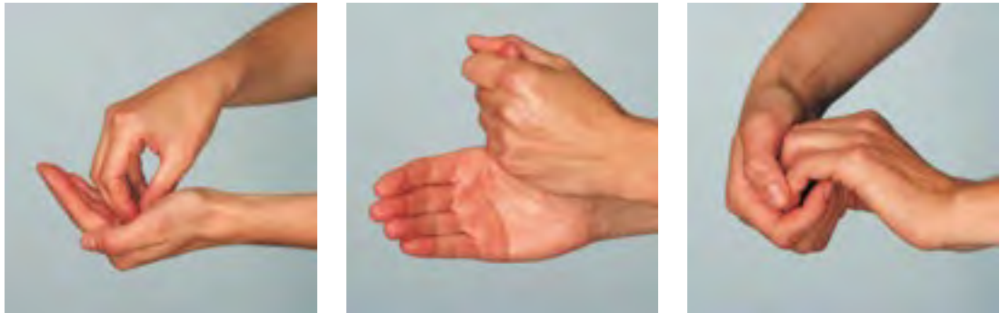
Einreibemethode zur Händedesinfektion in drei Schritten

Besondere Aufmerksamkeit gilt dem Einreiben von Fingerkuppen, Nagelfalz und Daumen.